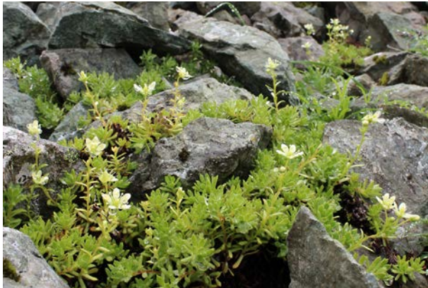
「世界に1㎡だけの花」ユウバリクモマグサ。

夕張岳に希産するユウバリクモマグサ（ユキノシタ科）は、生育面積が1平方メートル程度で生育地の崩壊で絶滅する危険があります。一方で本種には、東北アジアに広く分布するシコタンソウと同じ種、或いは、シコタンソウとエゾノクモマグサとの雑種とする分類学説があり、保全価値が定まっていませんでした。系統関係や