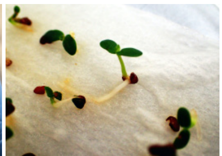
液体窒素で約半年間保管後に行なった発芽試験で発芽したオオバフジボグサの芽生(発芽率100%)。