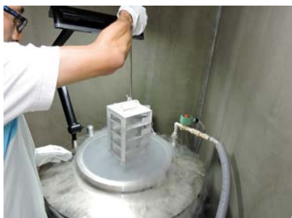
液体窒素保管容器と作業状況。

※超低温による絶滅危惧植物の種子保存は、環境省・日本植物園協会連携事業「希少野生植物の生息域外保全検討実施委託業務」のうち「種子保存に関する検討」の一環として実施されています。本業務の検討委員、関係する皆様にこの場を借りてお礼申し上げます。